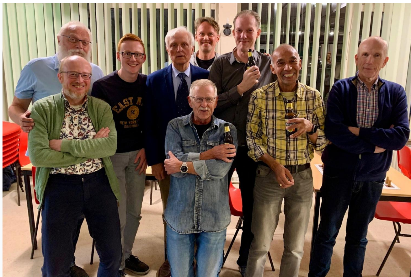
Foto van het Kampioensteam genomen door de sympathieke Dordtenaar Boris Iliev (Sha Mata, barista Couples).