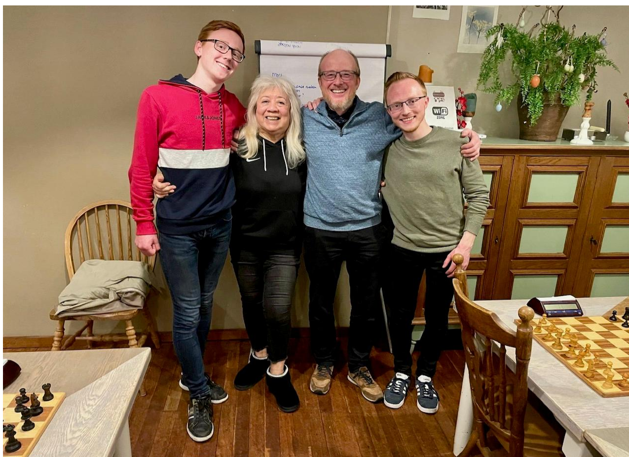
Conchita heeft het hele schaakgezin van de Velde nu 'gehad'

RSB D2 blijft in de race Saturday, 22 March 2025 10:46 | Written by Ton Slagboom | Hits: 172